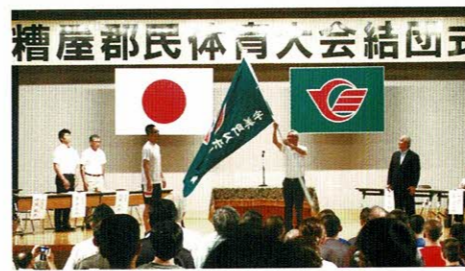
糟屋郡民体育大会 宇美町結団式 平成30年7月21日(土)

2. 第67回糟屋郡民体育大会 平成30年7月29日(日) 宇美町選手団 399名 参加