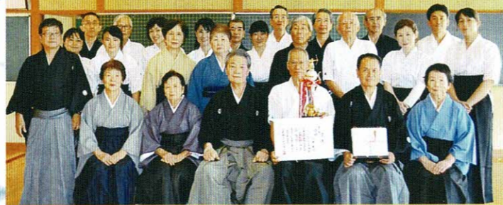
第66回 宇美八幡宮秋季奉納弓道大会