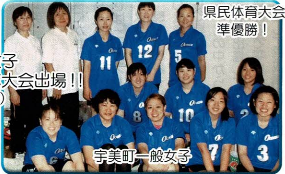
県民体育大会 準優勝!