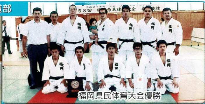
福岡県民体育大会優勝