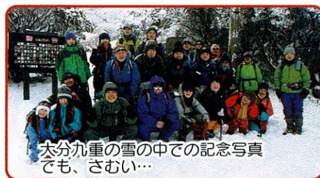
大分九重の雪の中での記念写真でも、さむい...