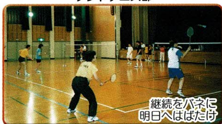
継続をバネに明日へはばだけ