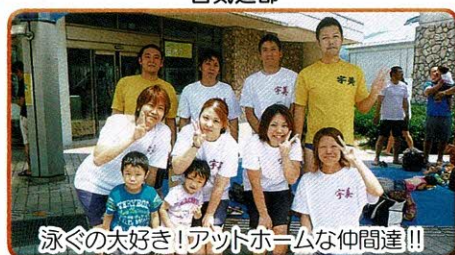
泳ぐの大好き! アウトホーム仲間達!!