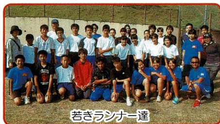
若きランナー達 陸上部