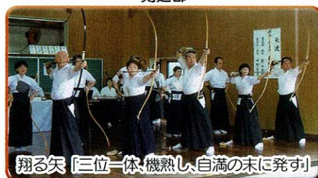
翔る矢「三位一体・機熟し・自満の末に発す」