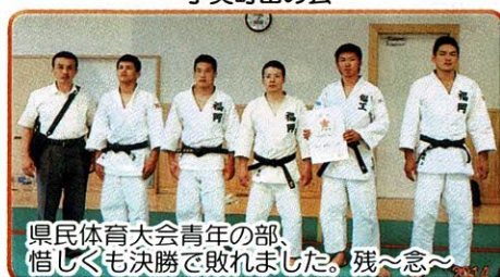
県民体育大会青年の部、惜しくも決勝で敗れました。残〜念〜