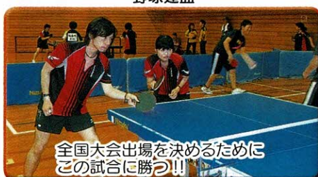
全国大会出場を決めるためにこの試合に勝つ!!!