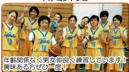
年齢関係なく男女仲良く練習しています! 興味ある方ぜひ一度!