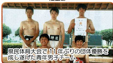
県民体育大会で11年ぶりの団体優勝を成し遂げた青年男子チーム