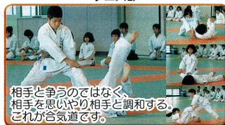
相手と争うのではなく、相手を思いやり相手と調和する。これが合気道です。