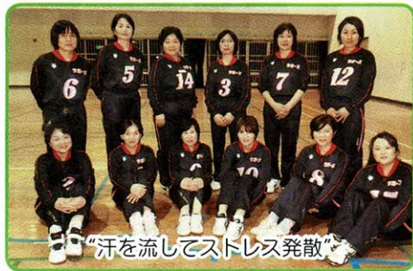
「汗を流してストレス発散」