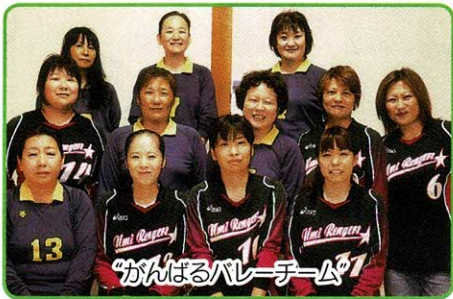
「がんばるバレーチーム」