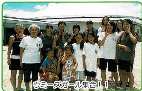
ウミズガール集合!!!