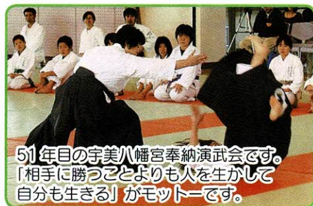
51年目の宇美八幡宮奉納演武会です。 「相手に勝つことよりも人を生かして 自分も生きる」がモットーです。