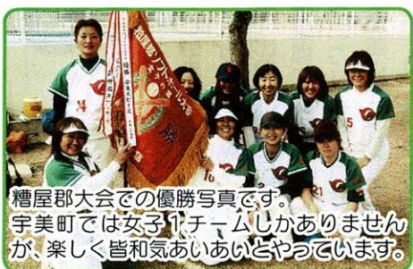
糟屋郡大会での優勝写真です。 宇美町では女子1チームしかありません が、楽しく皆和気あいあいとやっています。