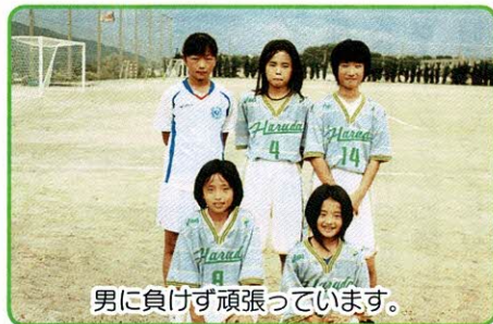
男に負けず頑張っています。