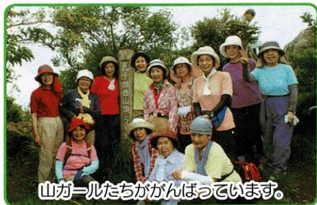
山ガールたちががんばっています。