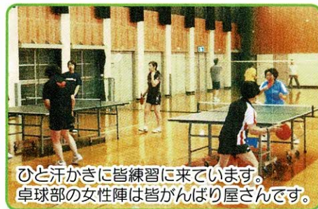
ひと汗かきに皆練習に来ています。 卓球部の女性陣は皆がんばり屋さんです。