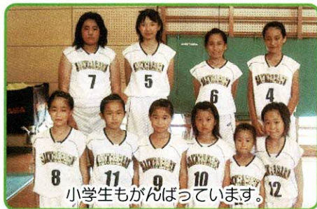
小学生もがんばっています。