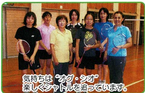
気持ちは「オグ・シオ」 楽しくシャトルを追っています。