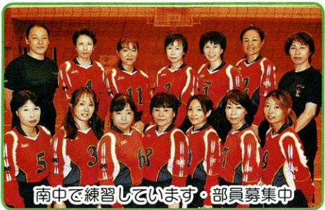
南中で練習しています・部員募集中