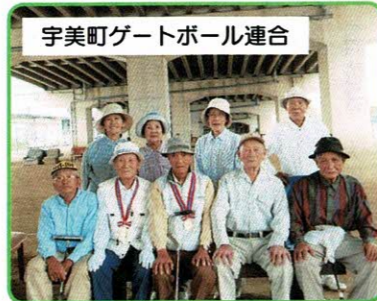
宇美町ゲートボール連合