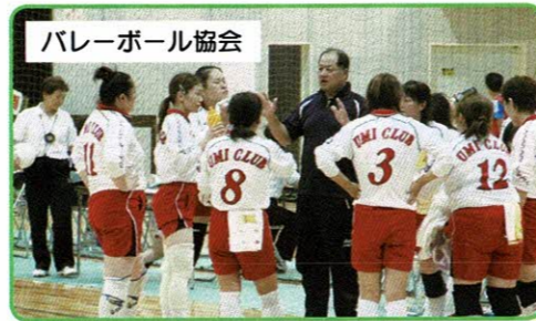
バレーボール協会